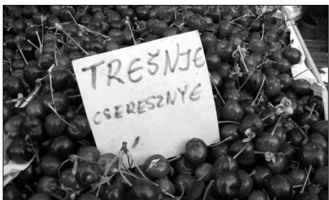
Stigle su i trešnje