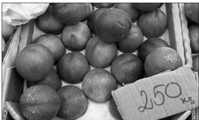
Nektarina za 250 din.