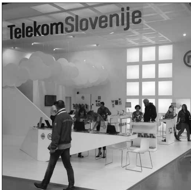
Detalj sa sajma u Celju

Sa svoje strane svakako smatram uspešnim naše sajamsko učešće, jer smo mogli voditi otvorene razgovore o mogućoj saradnji Subotice i Celja. Pošto su privrede obe zemlje, i Srbije i Slovenije zainteresovane za razvoj privredne saradnje, za upoznavanje međusobne ponude još uvek sajmovi pružaju jednu od najvažnijih mogućnosti. Upravo iz tih razloga smo razgovarali o tome, na koji način mogu dva sajma pomoći u predstavljanju privrede druge zemlje. Dogovorili smo se da ćemo pomoći u organizaciji nastupa preduzeća iz druge zemlje, ali smo svesni da rezultati tih aktivnosti u velikoj meri će zavisiti i od aktuelne ekonomske situacije. Mišljenja sam da Srbija za Sloveniju predstavlja vrata za nastup na tržištima trećih zemalja, što će firme iz Slovenije svakako želeti iskoristiti, ali u cilju toga potrebno je dalje jačati međusobne privredne odnose i saradnju.