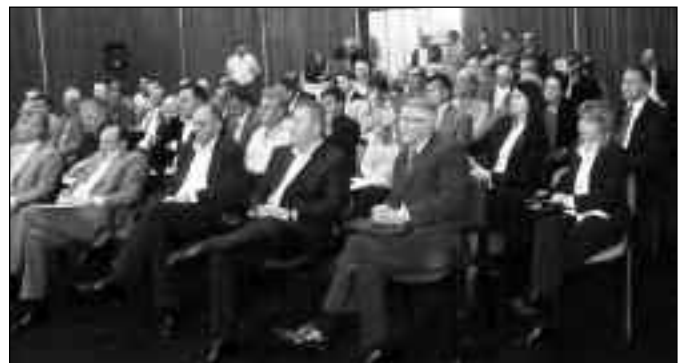
Sastanak o nacrtu zakona

- U Kragujevcu smo razgovarali o mnogim važnim pitanjima, između ostalog i o nacrtu zakona o komunalnim delatnostima. Predstavnici ova dva poslovna udruženja su zadovoljno konstatovali, da zahvaljujući dobro usklađenim aktivnostima i