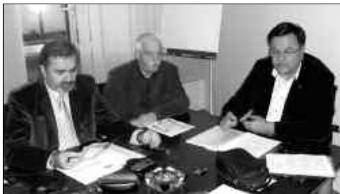
Sa sednice UO PUPS-a

stavovima kod zakonodavaca ponovo su uspeli postići, da se pri izradi zakonskih rešenja uzmu u obzir mišljenja zainteresovanih preduzeća. Tako je to bilo sa nacrtom zakona o trgovini, u kojem pijačna delatnost je najzad tretirana na odgovarajući način, a u novom nacrtu zakona su uzeli u obzir sve dosadašnje predloge i primedbe zainteresovanih preduzeća, a prvenstveno to, da će sva komunalna preduzeća odnosno sve delatnosti imati istovetan tretman, odnosno, da neće biti važnijih i manje važnih komunalnih delatnosti. Zakonodavna komisija poslovnog udruženja pijačnih uprava Srbije je obavila dobar posao, i ovom prilikom je razradila konkretne predloge, koje smo do 10. juna dostavili nadležnom ministarstvu.